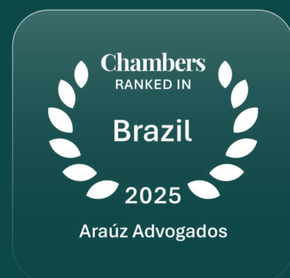
Reconhecidos na categoria "Labour & Employment"

Somos amplamente reconhecido em nossas práticas de atuação. Nossos advogados vêm sendo reconhecidos por publicações nacionais e internacionais de prestígio. Reconhecimentos como os conquistados até hoje mostram a evolução de nossa atuação jurídica em todo país.