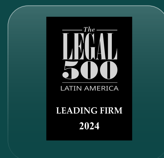
Reconhecidos na categoria "City Focus - Curitiba - Leading Firms"